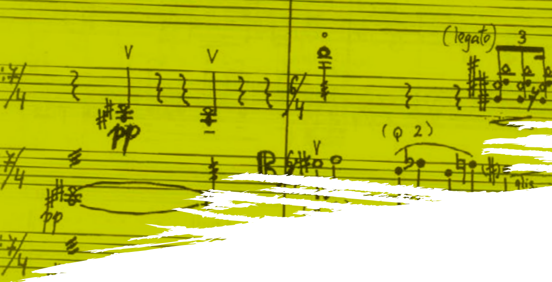
Trois Mouvements Concertants pour quatuor de violoncelles, par Kryštof Mařátka, 1995.